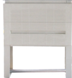
Sockel separat zu bestellen