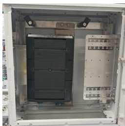
230448 F5 mit Muffe 3M BPEO Gr.2 auf 190580 Glasfasereinsatz