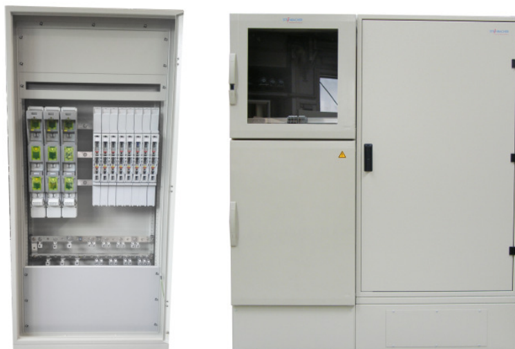
Kombination mit Messwandlerschrank