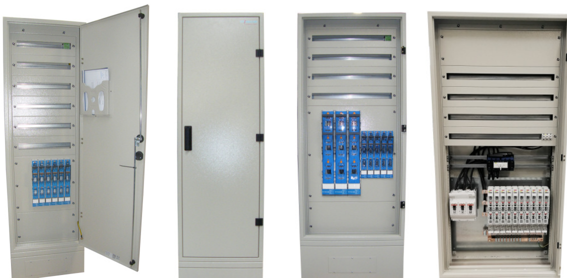
Ausführung mit NH-Lastschaltleisten bzw. NH-Lasttrennschalter

Beispiele für auftragsbezogene Sonderstandverteiler: